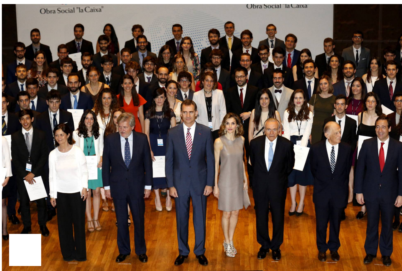
Los Reyes, en la entrega de becas de la Caixa para 120 estudiantes de posgrado.

Felipe VI ha reivindicado la formación como instrumento “esencial para garantizar la igualdad de oportunidades” a las nuevas generaciones de españoles que pueden verse limitados por los recursos económicos. El Rey ha recurrido a un mensaje de profunda carga social en un contexto en el que, como consecuencia de la crisis, muchas familias han tenido que renunciar a los proyectos formativos de sus hijos y en un acto, como la entrega de las